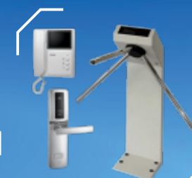
СИСТЕМЫ УПРАВЛЕНИЯ И КОНТРОЛЯ ДОСТУПОМ